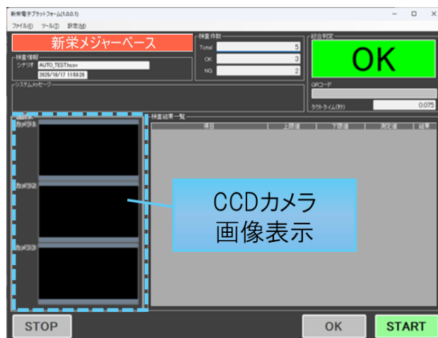
カスタマイズした検査画面

暗箱・遮光ボックス内の製品に対し、3つのCCDカメラでラベル撮影。ラベル位置や記載内容をチェックして良否判定。